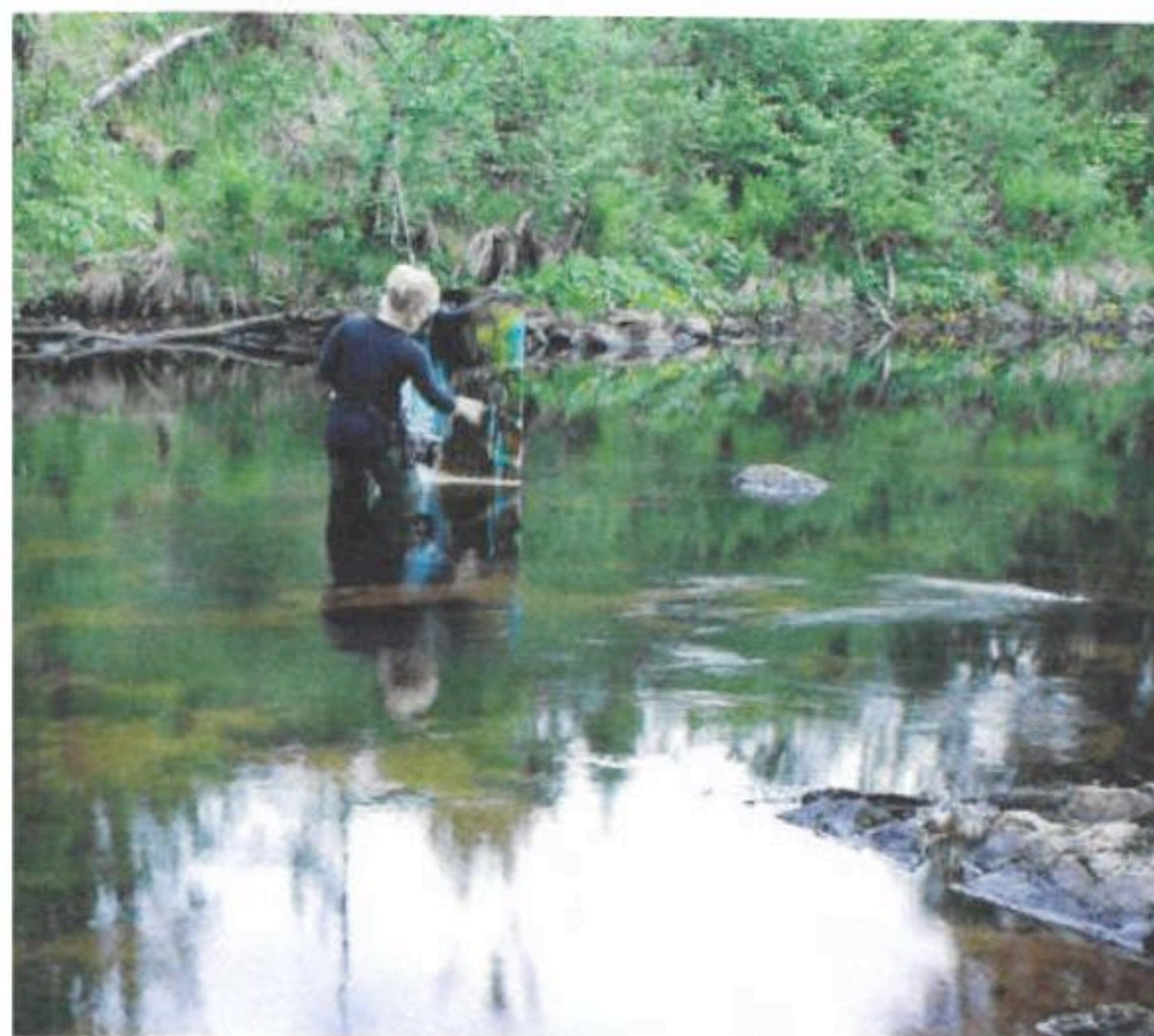
▼ Dokumentasjonsfoto fra arbeidet i elva.

Overflaten av vann reflekter lyset på så uendelig forskjellige måter - vatn kan være en reflektor, et