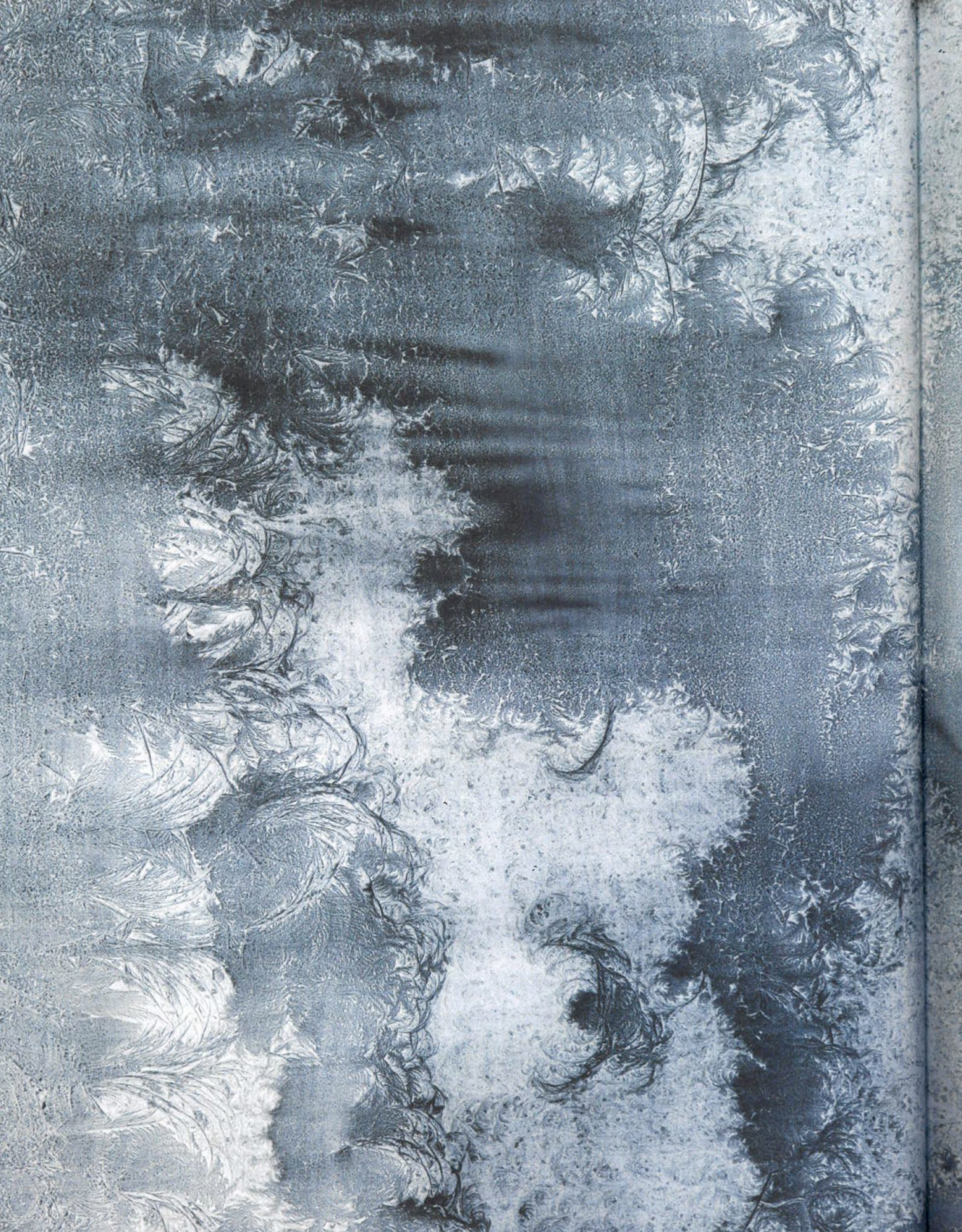
▲ Janicke Schönning Superiour Slug Del av serie med samme navn, gouache og spor av snegler på papir, 57x73, 2017