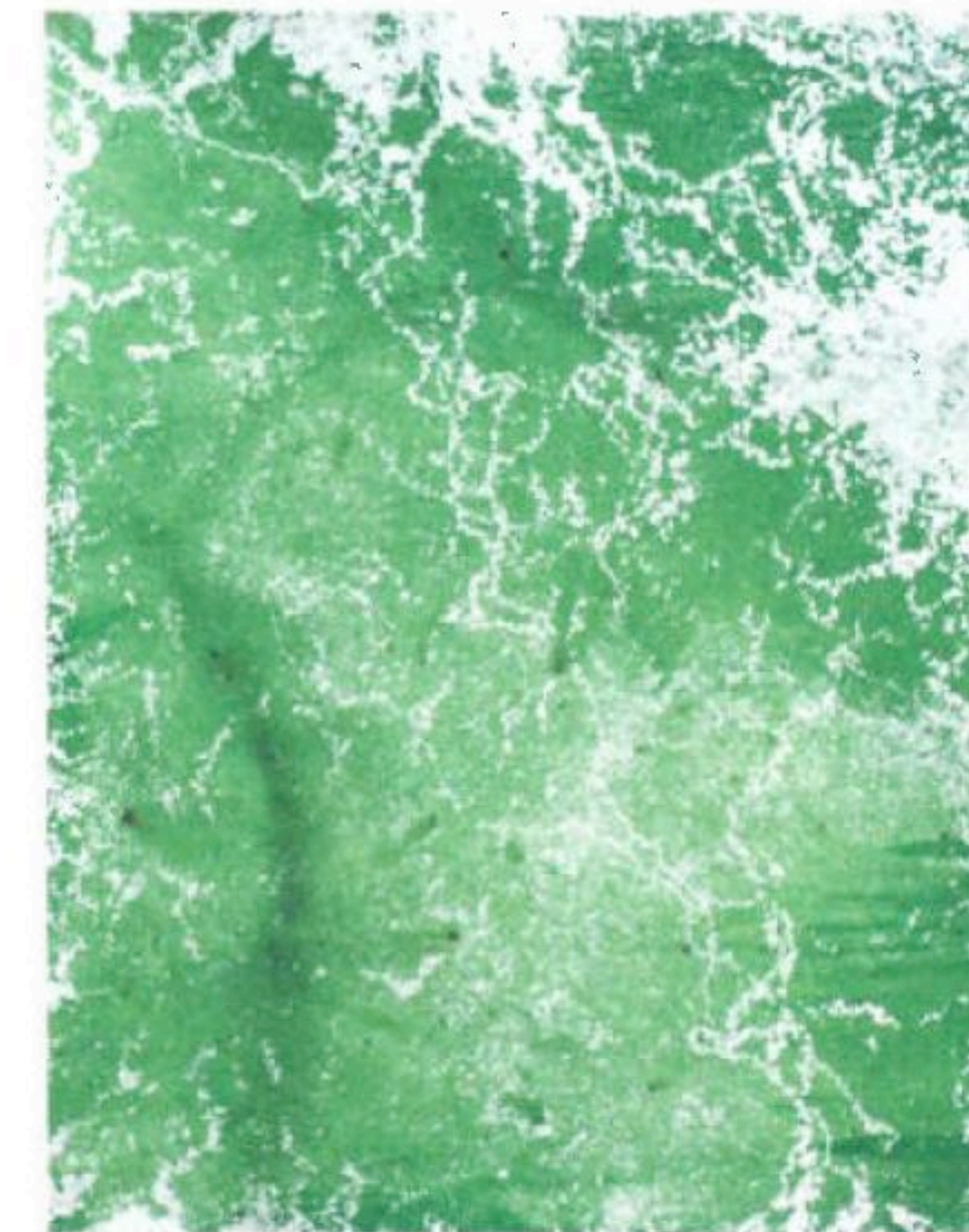
En samtale med Janicke Schönning